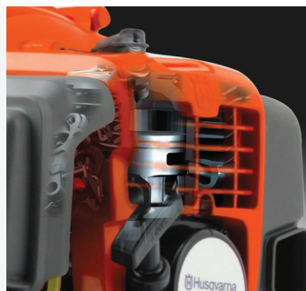
X-TORQ® X-TORQ® motorn ger minskad bränsleförbrukning och mindre skadliga utsläpp.